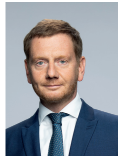
Michael Kretschmer Ministerpräsident des Freistaates Sachsen